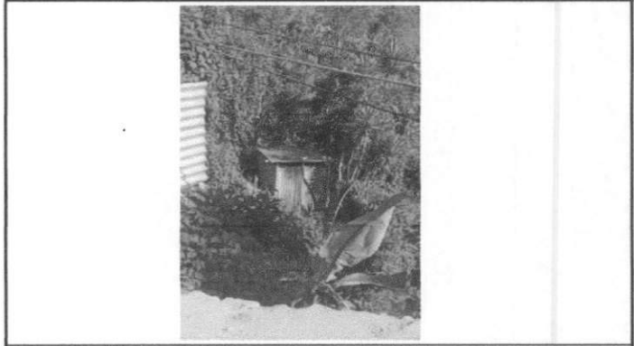
Foto 4: Sustitución de inodoro y Sustitución de tubería PVC lineal principal, aguas negras